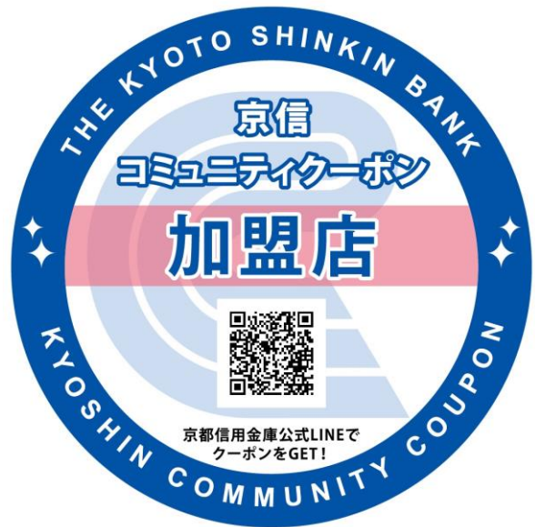
▲加盟店に貼付されるステッカー