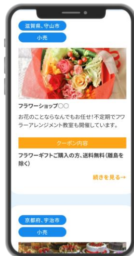
▲加盟店ナビ (スマホ)