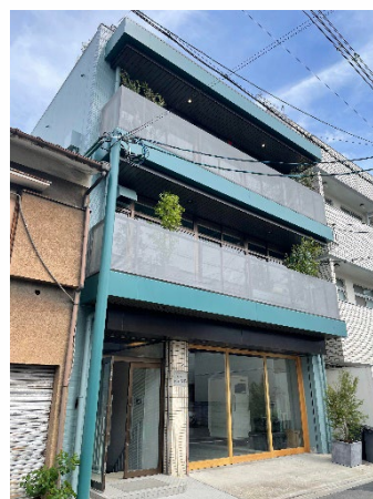
Umekoji MArKEt 外観