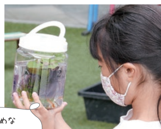
こまめな 水換えが大切