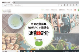
▲ 京田辺農福観地域づくり協議会様のHP