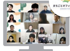
▲オンライン交流イベント 『まちごとオフィスLIVE』

インターンシップで『京信人材バンク』を知り、『まちごとオフィス』に登録し、オンライン交流イベントに参加しました。大学生の私にとって、 社会人の方の経験談やアドバイスは本当にためになり、聞き入ってしまいました。 “ 経験することの価値 ”を知ったので、学生のうちにどんなことにも挑戦していきます。まだまだ聞き足りない部分があるので次回も楽しみです!