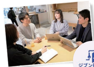
▲お悩み相談会の実施

『まちごとオフィス』は、複業実践者と接点を持つことで 自分に足りないスキルの底上げが期待できる 斬新なコミュニティだと感じ、登録しました。本業の垣根や年代・性別を超えて集まったみんなで、 「働き方に対するアイデアを形にしたい」との想いで語り合う この場は、とても居心地がいいです。今後も積極的に参加し、取り組んだ経験を複業に活かしていきたいです!