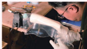
楠岡義肢製作所 株式会社 様 (義足やコルセットの製造)

インソールの熱成型や金属コルセットの組み上げ作業などを見学しながら、職人と交流。