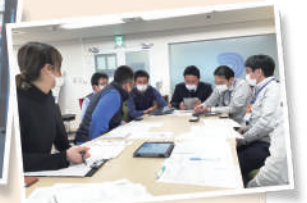
CF組成のために何度も打合せ