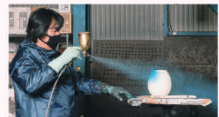
有限会社 Nao漆工房 様 (仏壇や仏具の製造・修復)

インソールの熱成型や金属コルセットの組み上げ作業などを見学しながら、職人と交流。