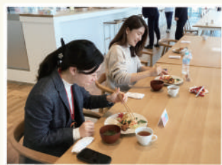
▲ 試食する京信職員