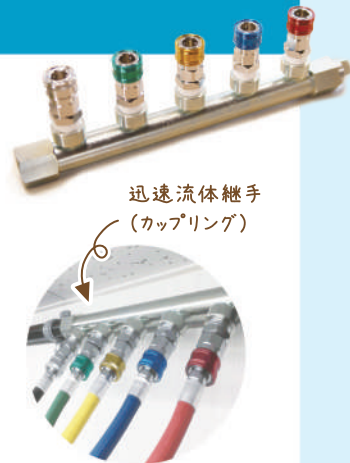
迅速流体継手 (カップリング)

弊社は、迅速流体継手(カップリング)の専門メーカーです。近年、製品への安全意識の高まりから、得意先より求められる品質管理のレベルが高くなってきました。 より精密な測定器の導入の必要性 に迫られていたそんな時、京信さんが東大阪市の補助金の活用を提案してくださったのです。