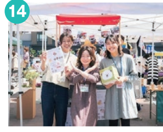
14 らくさいっこ 団地の空室をDIY! 繋がりが生れる 場づくりに取り組む3人組 ミニゲーム等あります!