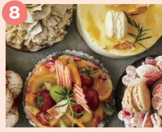
8 la patisserie de da~da 旬のフルーツを使い、味・見た目に こだわったお菓子を販売