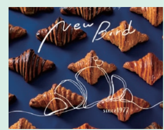
New Bird 石釜焼きの見た目も鮮やかな クロワッサンと サンドイッチのお店