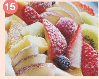
15 Pâtisserie NICO 素材の風味を生かした 甘さ控えめ手作り焼き菓子