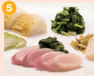
5 京つけもの かたやま 昔ながらの下漬け・本漬けを ほどこしたお漬物をご賞味ください