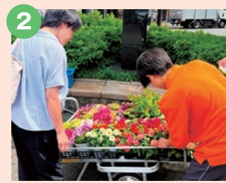
2 京都府立桂高等学校 植物クリエイト科・園芸ビジネス科 生徒の方々が丹精込めて育てた 地元で評判の野菜やお花の即売