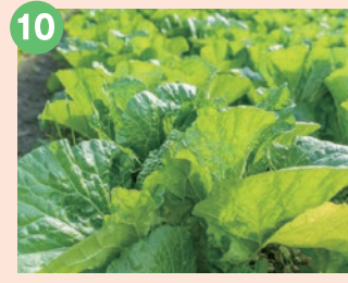
10 むかい農園 地元の大原野で採れた新鮮な 旬のお野菜やお味噌など販売