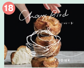
18 Choux Bird クロワッサン専門店が創る シュークリームの専門店