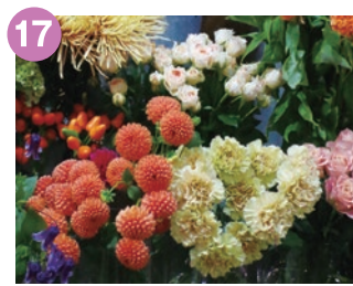
17 Rosetta*H (ロゼッタアッシュ) 花や植物にまつわるアイテムを 提案するフラワーブランド