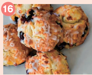
16 MALMA PLACE 本場の美味しさにこだわった、 種類も豊富なハワイアンズコーン