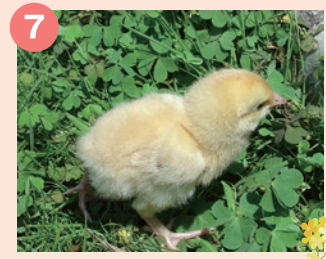
7 佐藤養鶏場 養鶏場直営の 鶏肉・新鮮卵・濃厚プリンが絶品