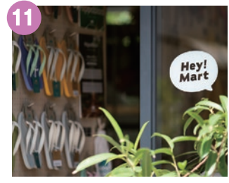
11 Hey! Mart 「日常に心ばかりのワクワクを。」 夫婦で営む、ライフスタイル雑貨店