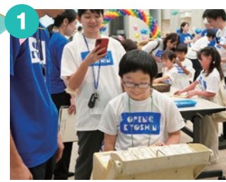
1 コミュニティ・バンク京信 お金にまつわるゲームを開催! ※写真はイメージです