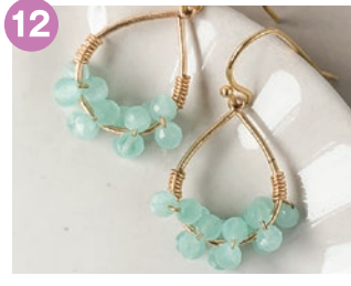
12 ハンドメイド雑貨店 hitotoiro 阪急西山天王山駅(東口)から徒歩 5分のハンドメイド雑貨のお店です。