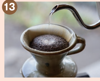
13 暮らしランプ (NAKANOTEI COFFEE) 暮らしランプ運営「なかの邸コーヒー」 で販売のこだわりのコーヒー