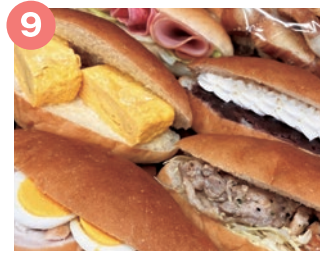
9 ぱん工房小麦の糎 (こむぎのはな) からだが喜ぶ米麹ぱん