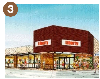
3 リバティ長岡店 フレンドリーが魅力の 地域のスーパー。飲み物等販売