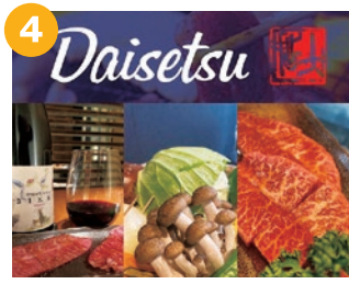
4 焼き肉の大拙 長岡京本店 こだわりの焼肉弁当と キムチやナムルのパックを販売