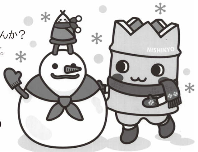
西京区マスコットキャラクター たけにょん