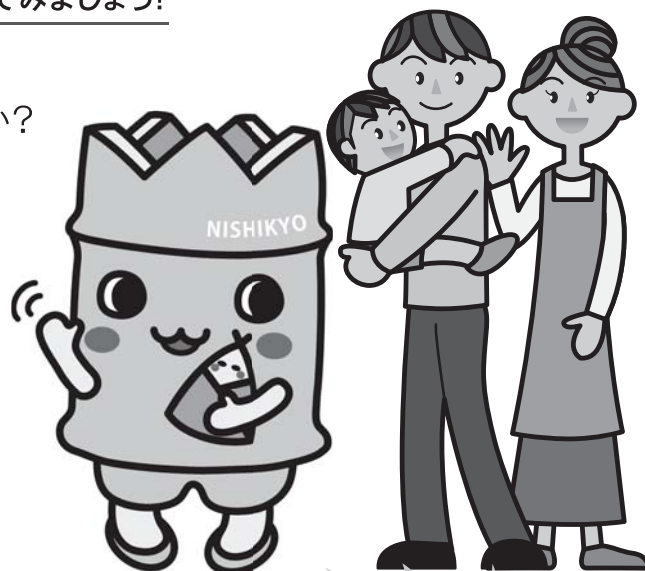
西京区マスコットキャラクター たけによん