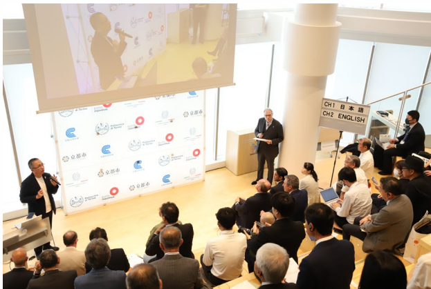
▲オープニングセレモニーにはたくさんの方がご来場されました