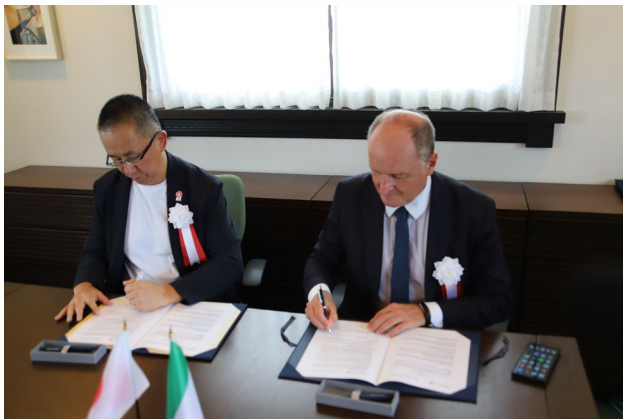
▲連携協定の調印式