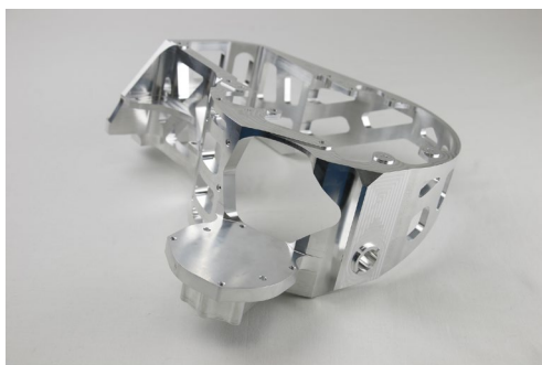
【光学センシング関連部品】