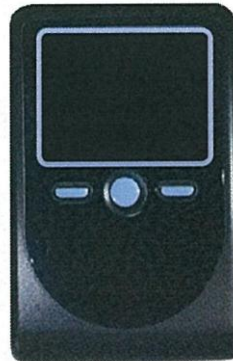
トランザクション認証用トークン