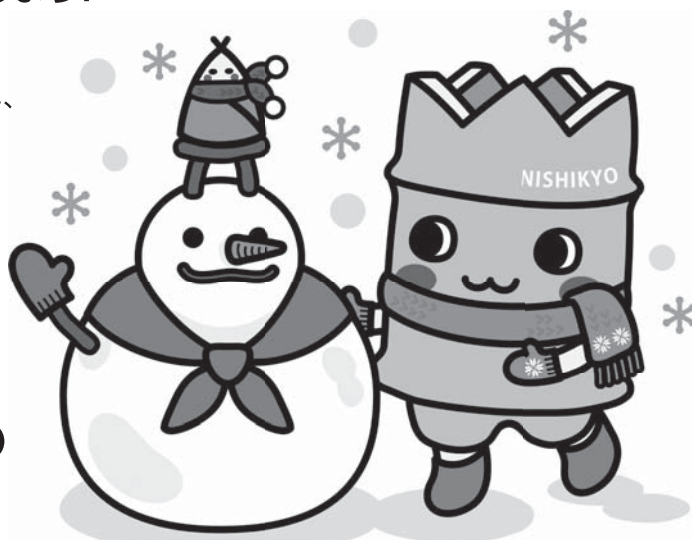
西京区マスコットキャラクター たけによん